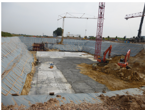
Abbildung 5: Neubau eines Regenrückhaltebeckens 81