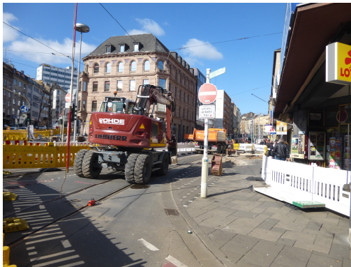
Abbildung 3: Verkehrswegearbeiten Bahnhofstraße 79

Durch den Einsatz von Fotodokumentationen wurden vorgefundene Situationen auf den Baustellen und die festgestellten Mängel veranschaulicht, was die Zusammenarbeit mit den betroffenen Bauleitern bei der Fehlerbearbeitung erleichterte. Als Folge der Vorortkontrollen ist die Rechnungsstellung durch die beauftragten Firmen und Subunternehmer wesentlich genauer und korrekter geworden. Beispiele: