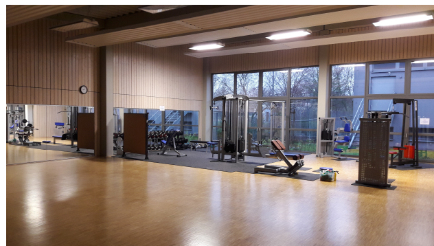
Abbildung 6: Neubau einer Gymnastikhalle 82

Durch Aufmaßprüfungen auf der Baustelle in den Bereichen Erd- und Rohbauarbeiten, Straßen- und Kanalbau, Außenanlagen usw. konnten gestellte Rechnungen nach unten korrigiert und Überzahlungen vermieden werden. Beispiele: