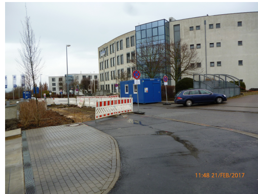
Abbildung 4: Endausbau Isaak Fulda-Allee 1 80